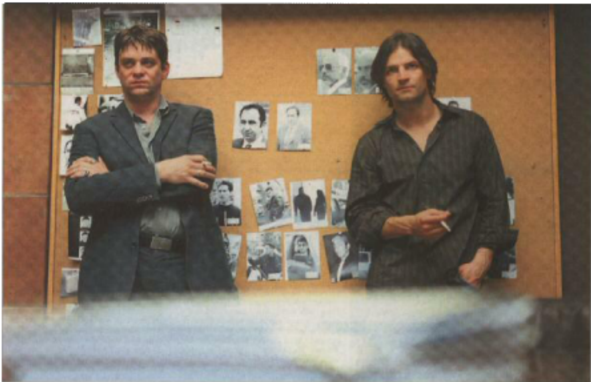
So sehen Freunde aus. Zusammen hatten die Drogenfahnder Paul (Miel Malsicvic, r.) und Boris (Roelnd Wiemcker) eine erfolgreiche Zeit in der Unterwelt – bis Paul aussteigen wollte. Paul verliert alles: seine Frau, sein Gedächtnis und sein bisheriges Leben. Boris hat längst nichts mehr zu verlieren.